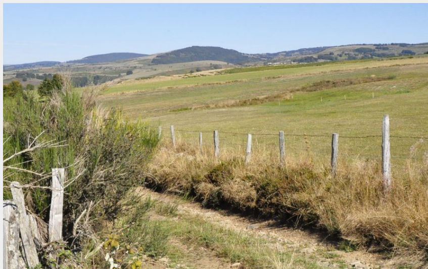
Les monts d'Aubrac depuis le chemin de crête