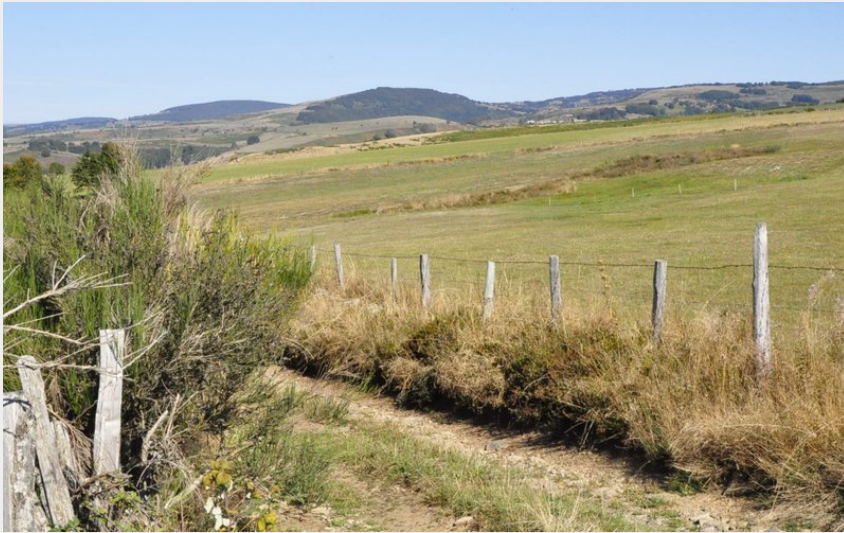
Les monts d'Aubrac depuis le chemin de crête (Office du Tourisme de l'Aubrac au Gorges du Tarn)