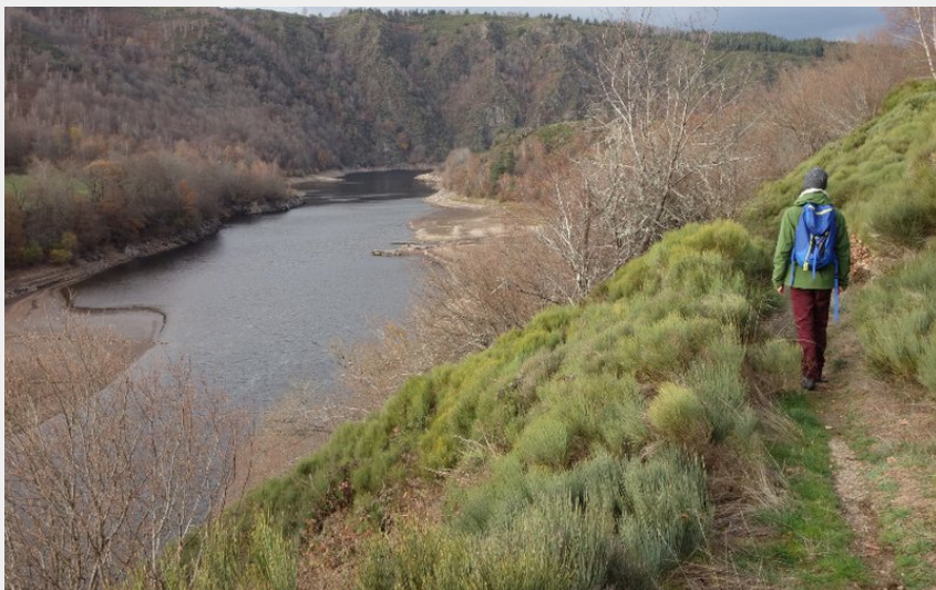
Le sentier longeant la vallée du Bès