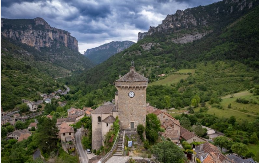
La Tour de Peyreleau - Gorges de la Jonte