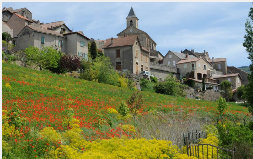
Cheminer au milieu des champs (OT Millau GC)