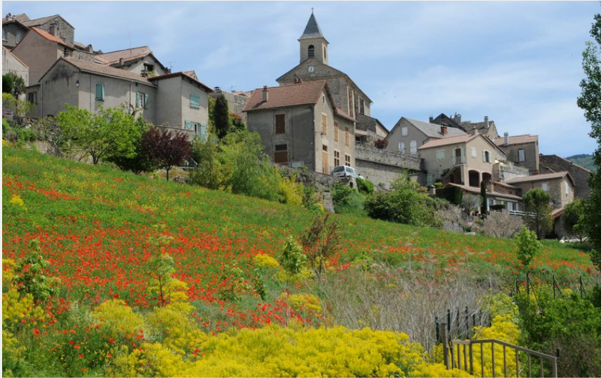
Cheminer au milieu des champs