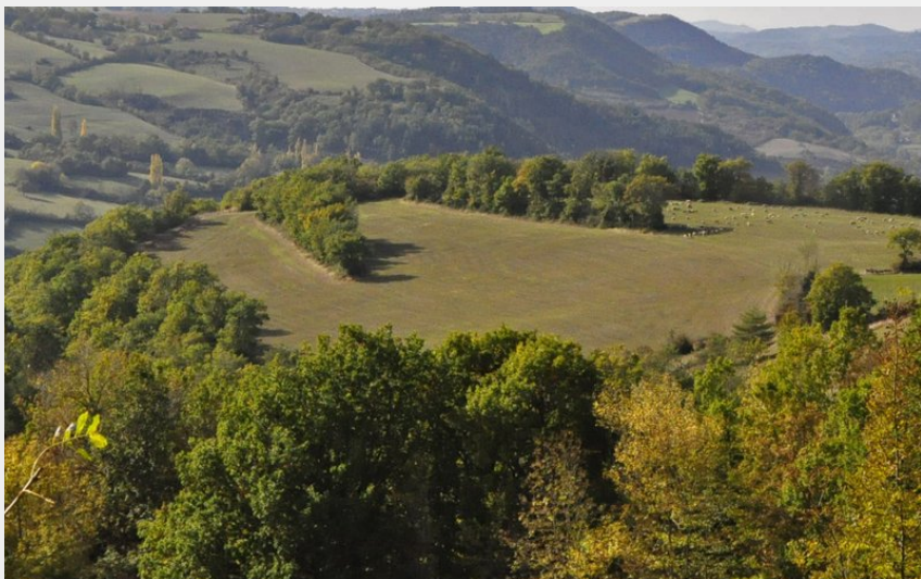
Vue du village de Coustous