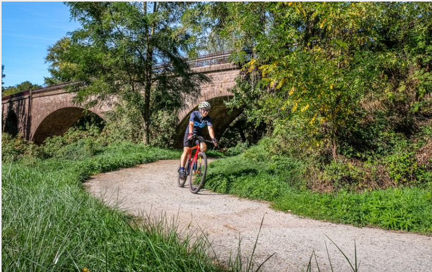
Berges de la Sorgues (Virginie Govignon)