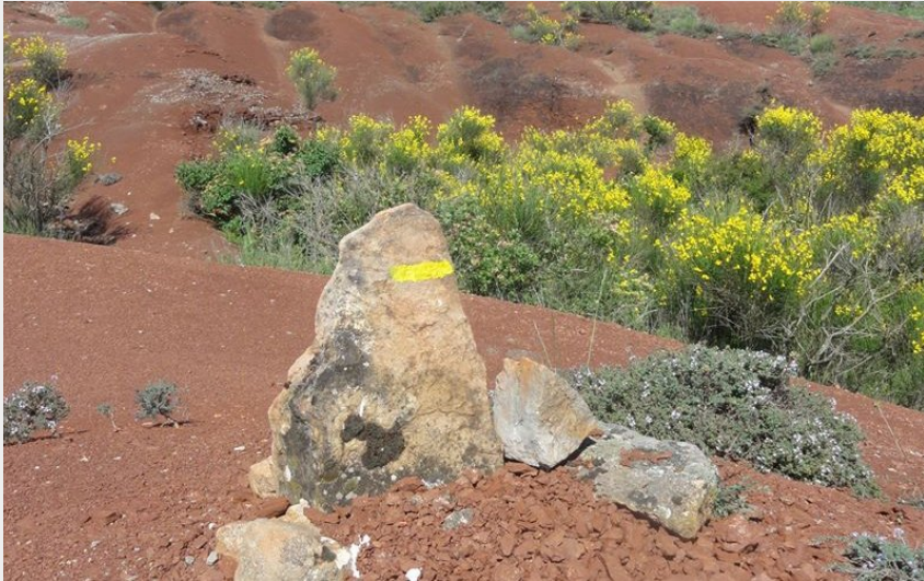
Le Rougier de Camarès (OT Rougier Aveyron Sud)