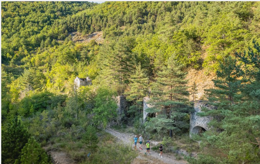
Le ravin des Valettes et ses fours à calamine