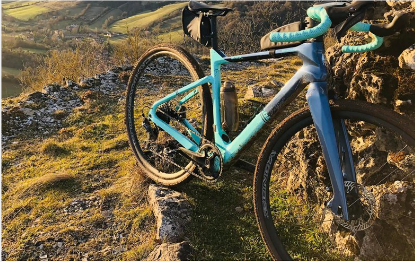
Panorama depuis le Causse (Bernard Dumas)