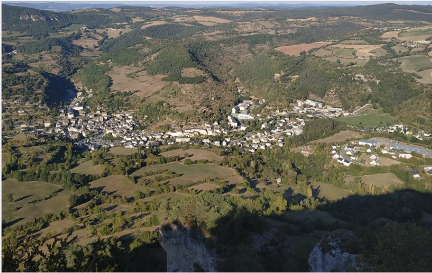
Vue sur la Canourgue (OTAGDT)