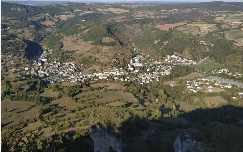
Vue sur la Canourgue