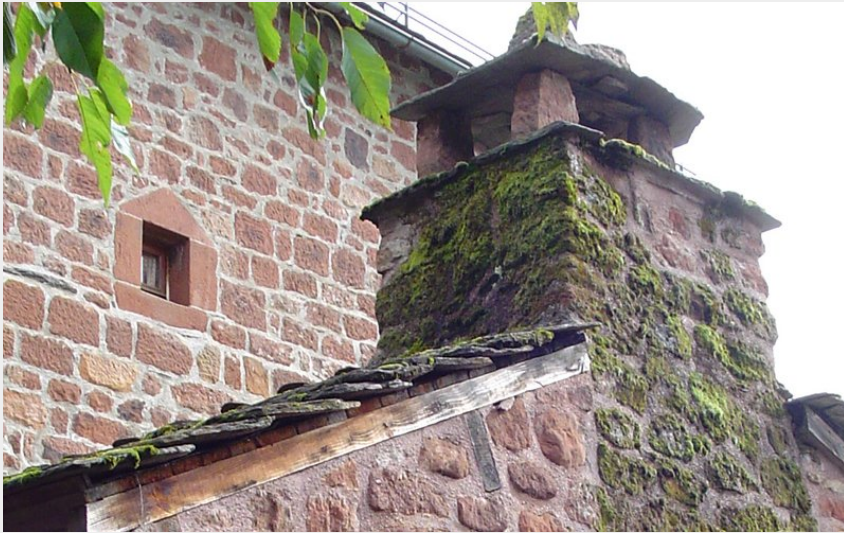
Cheminée en grès rouge