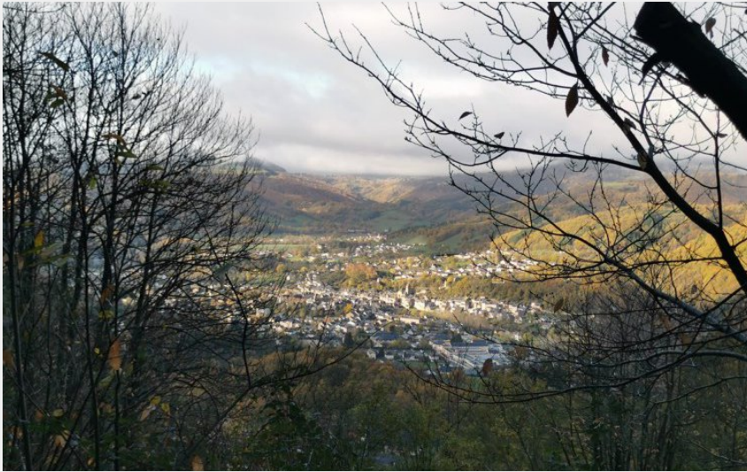
Point de vue sur St Geniez (Office de Tourisme)