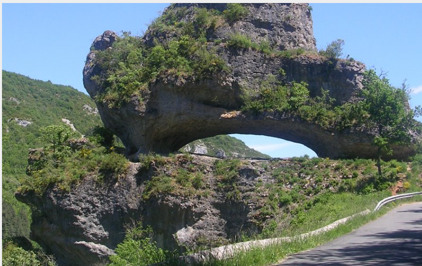
Le sabot de Malepeyre (OTAGDT)