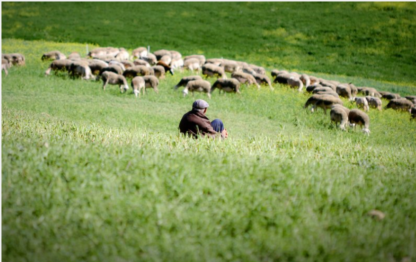
Troupeau de brebis Lacaune