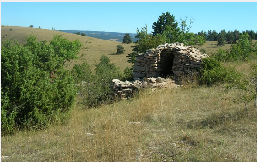
Chazelle sur la montagne fendue