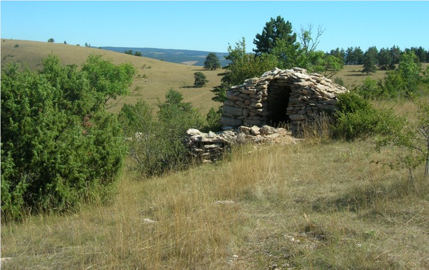
Chazelle sur la montagne fendue (OTCCGD)