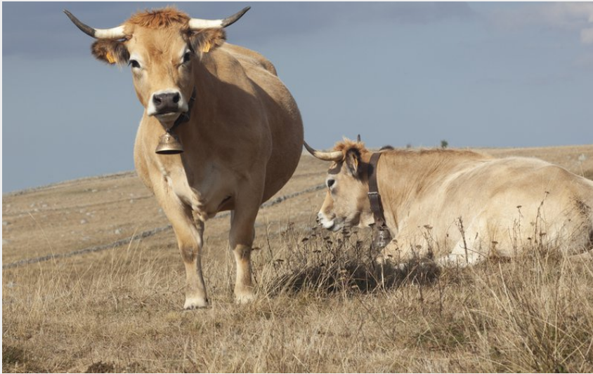
vache aubrac (Floris Fossey)