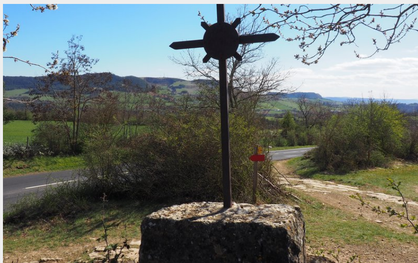
Sur le sentier des chazelles