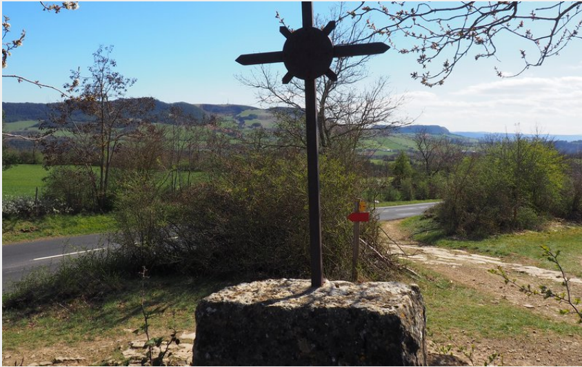
Sur le sentier des chazelles