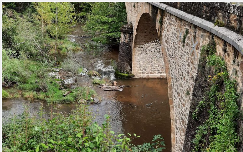
Pont dans la Vallée du Lot