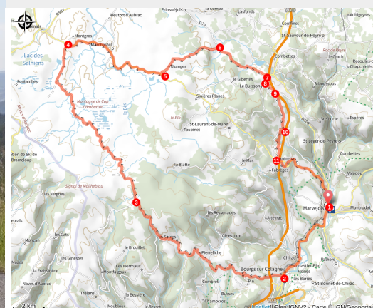
Sur la route des Lac et des Burons

Partez à l'ascension du plateau de l'Aubrac pour profiter des grands espaces au milieu d'une nature encore préservée.