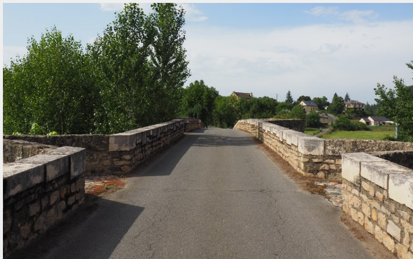
Pont de la Colagne à Chirac