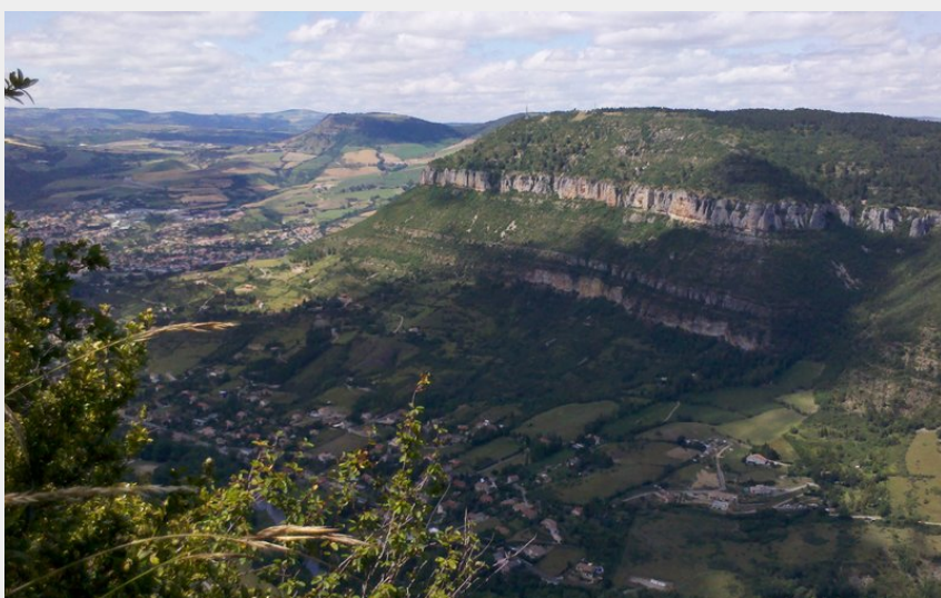
Vue de Millau depuis les corniches (GBarrabe)