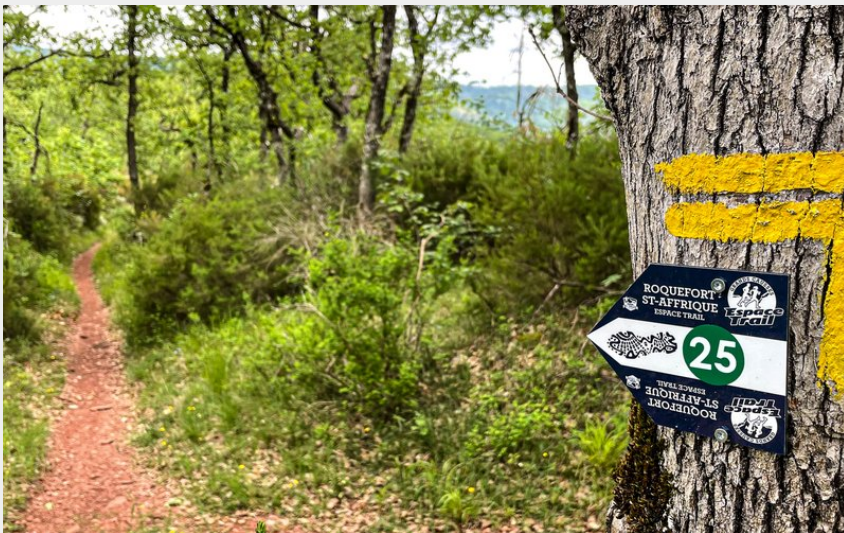
Monotrace (Roquefort Tourisme)