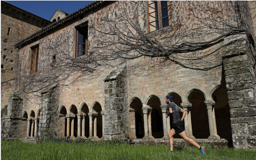
Abbaye de Sylvanès (G Bertrand)