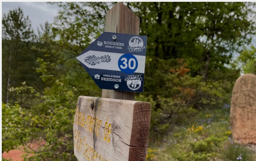
Montlaur (G Bertrand)