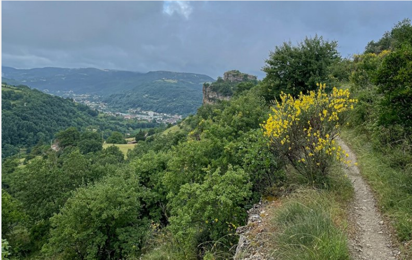
Vue sur le rocher de Caylus