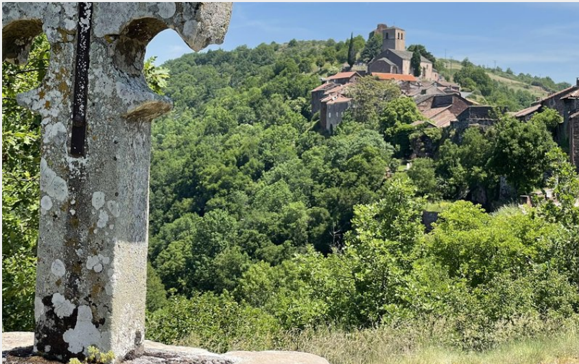
Croix du Serre (G Bertrand)