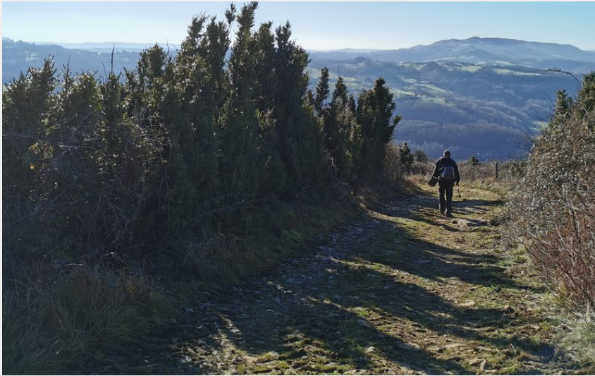
Descente sur Mandailles-vue sur le Lot