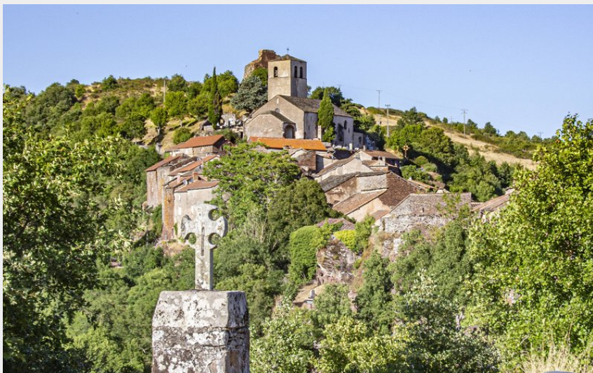
Sentier des Paredous (Steloweb)