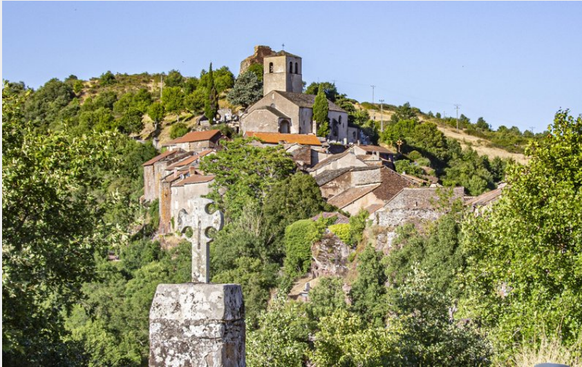
Sentier des Paredous (Steloweb)