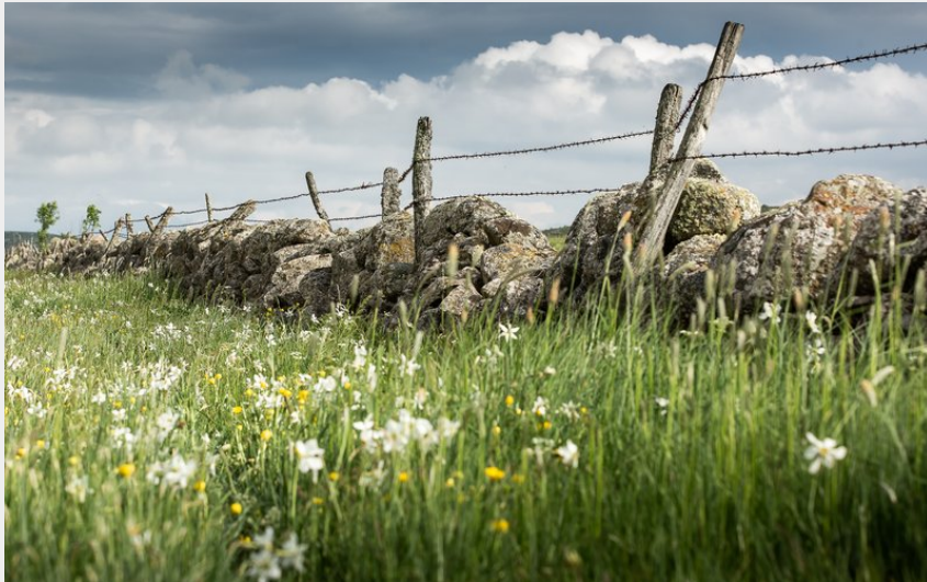
Muret d'estive avec des narcisses