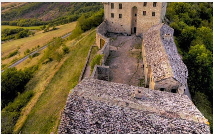
Château de Montaignut