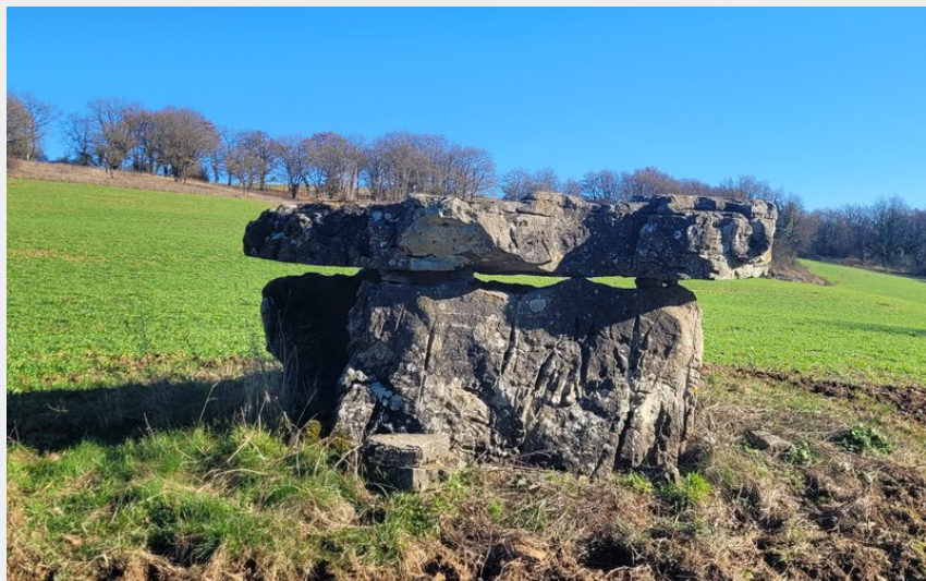
Pays de Roquefort