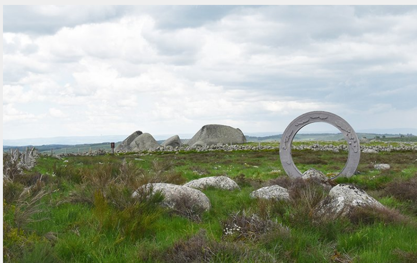
L'oculus au Roc des Loups, Marchastel, table de lecture verticale des paysages