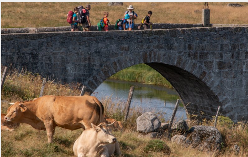
Le pont de Marchastel (Claude)