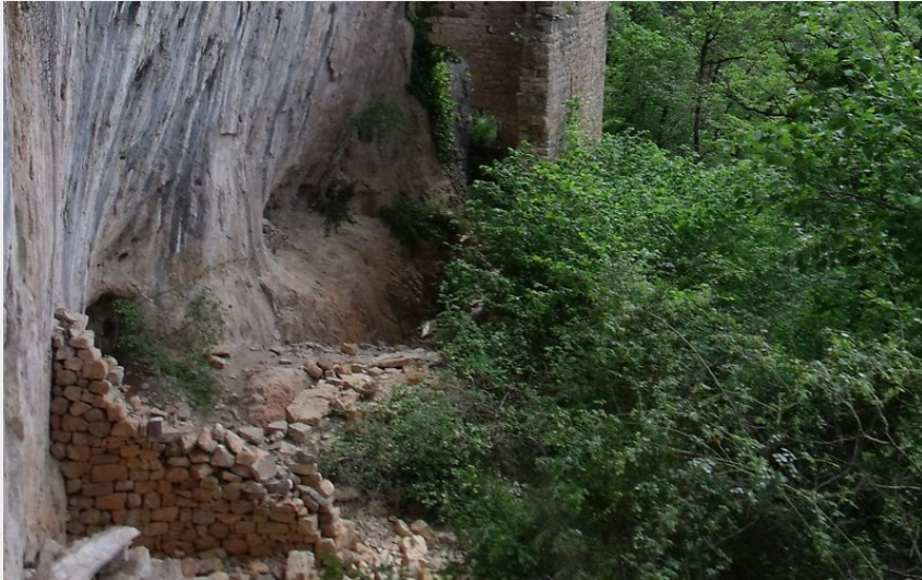
Ermitage St Pons (GBarrabe)