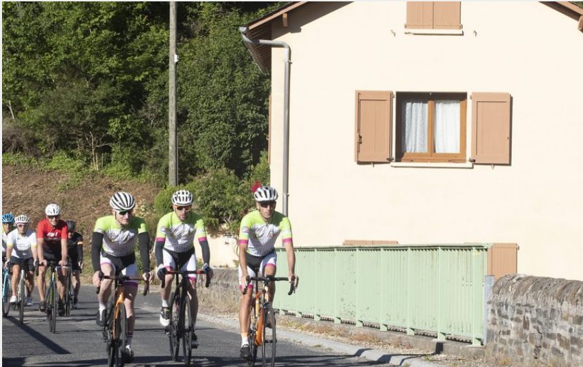
Entrée de Saint Léger de Peyre (Floris Fossey - OTCCGD)