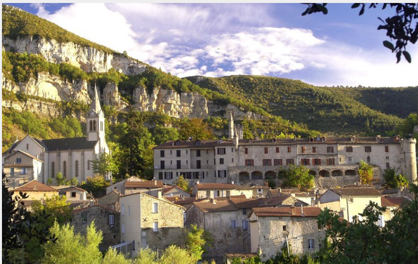
Village de Creissels (OT Millau GC)