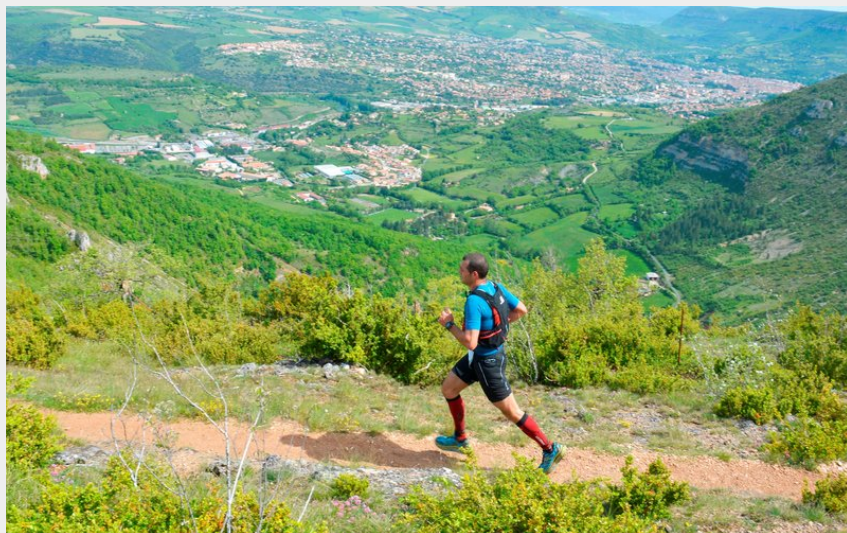
Sur les corniches (Larzac Trip Trail)