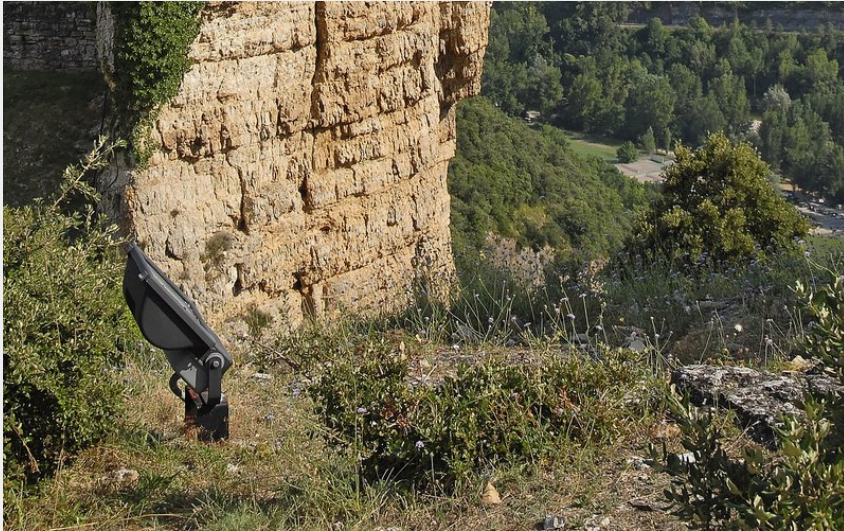
Le château de Peyrelade (Eric Teissedre)