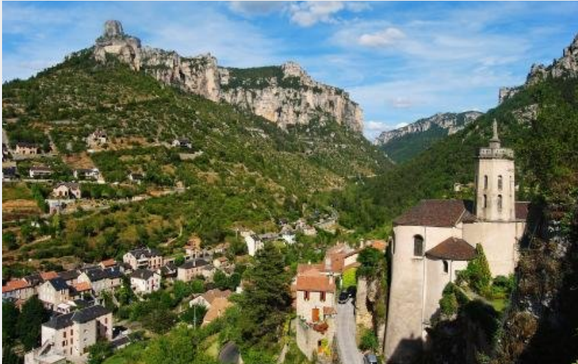
Rozier et ses falaises vues de Peyreleau (OT Millau GC)