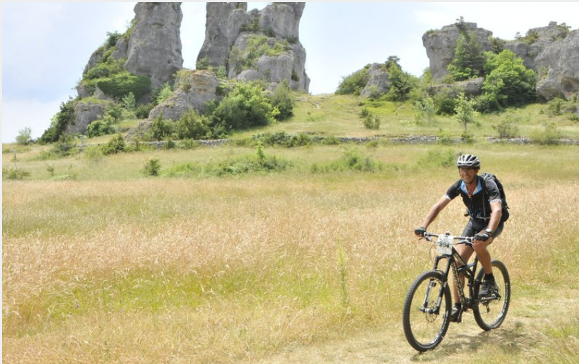
A coeur des chaos de Roquesaltes (La Caussearde)