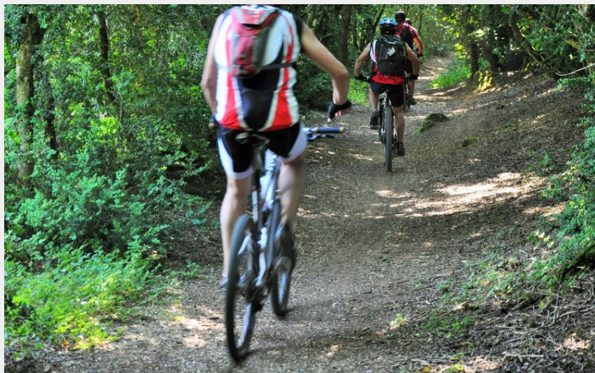
Dans les buissières du Larzac (La Caussearde)