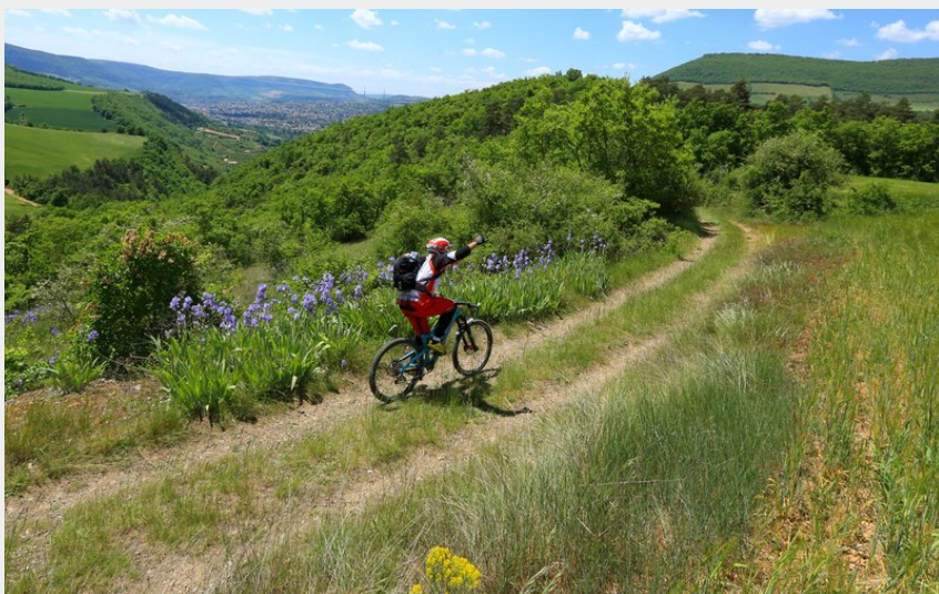
Entre pistes et singles, vues imprenables