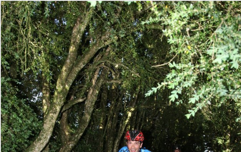
En parlant de buissière... (Caussearde)