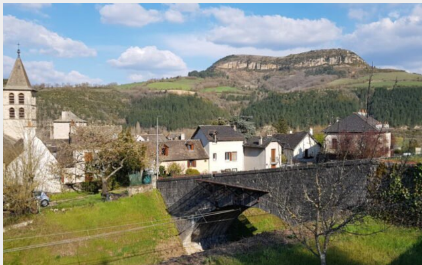
Le truc de Saint-Bonnet depuis Chirac